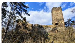
ZŘÍCENINA HRADU LIBŠTEJN